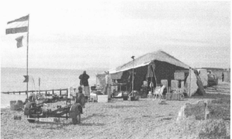
Afbeelding 4 Bivak op het strand