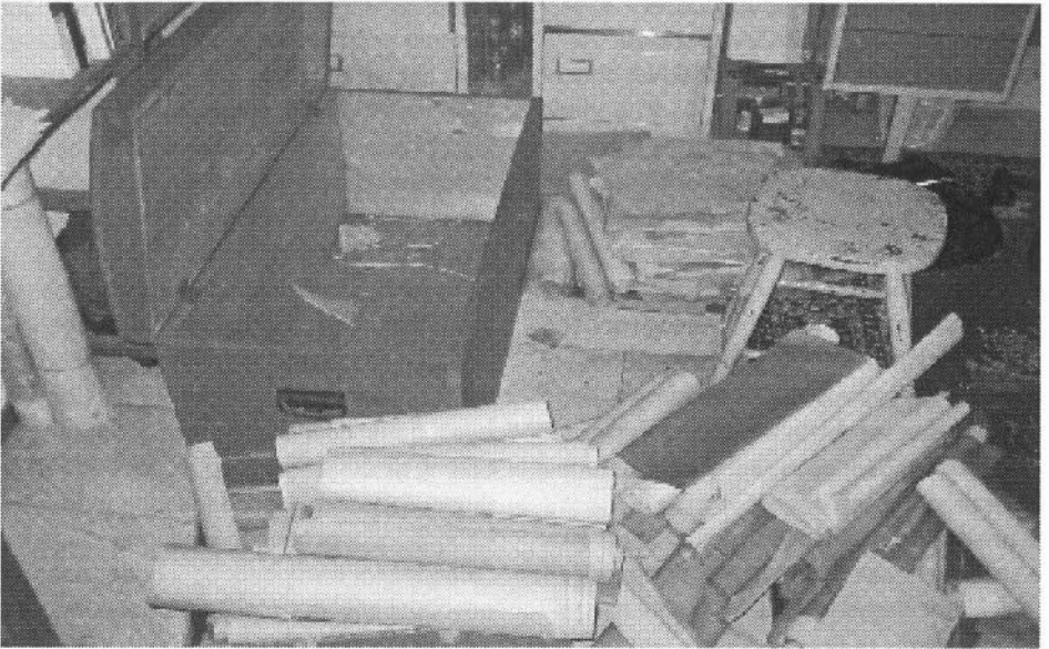
Afbeelding 3 Houten kist met tekeningen